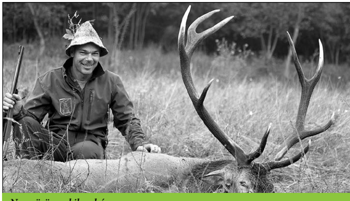
Nagy öröm – kilenclűsz

Az első nagyobb bikák elestéig – értjük alatta a tíz kiló feletti trófeákat – egészen kilencedikéig kellett várunk, viszont ezen a napon mindjárt három arany- és egy ezüstérmes bika került terítékre!