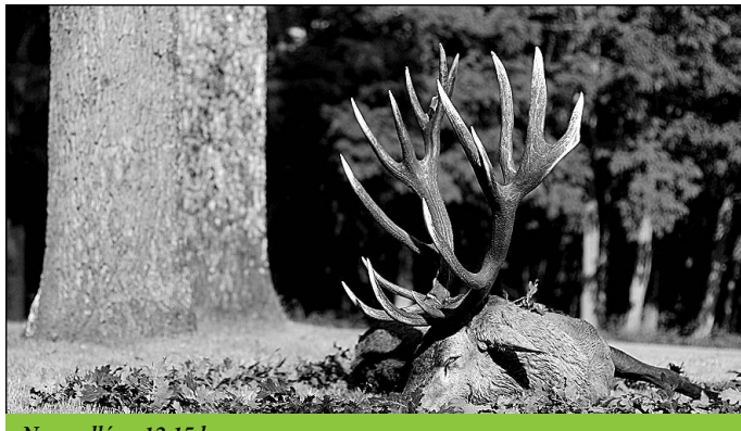
Nagysallér – 12,15 kg

Mindezek után jöttek meg az igazán esős napok, ami megmutatkozott a vadászatok sikerességében is. És ha a mennyiségben visszaesés is, a minőségben mindenképpen javulás volt tapasztalható! Tizenkét kilogramm felett kettő – egy Szántódon és egy Lábodon –, tizenegy felett pedig