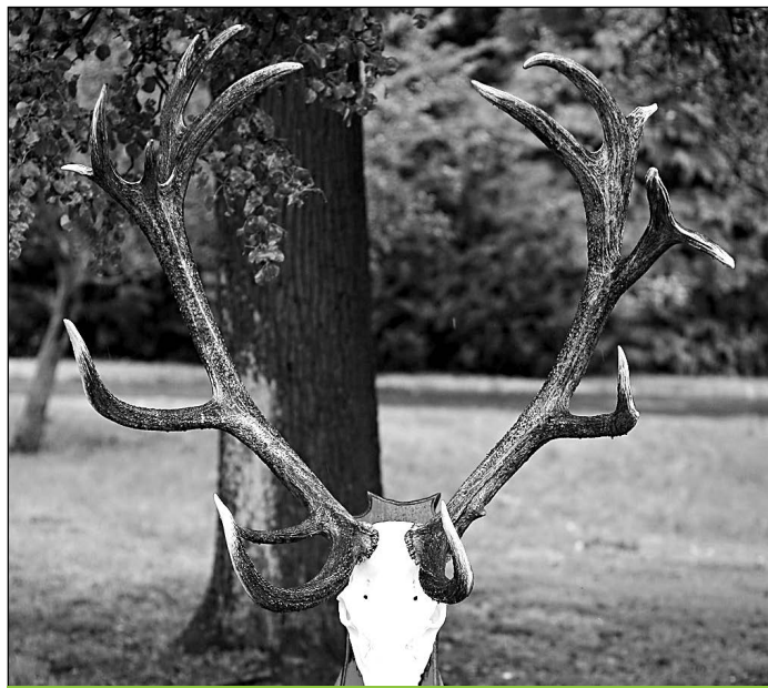
Szántód – 13,34 kg, 238,92 pont