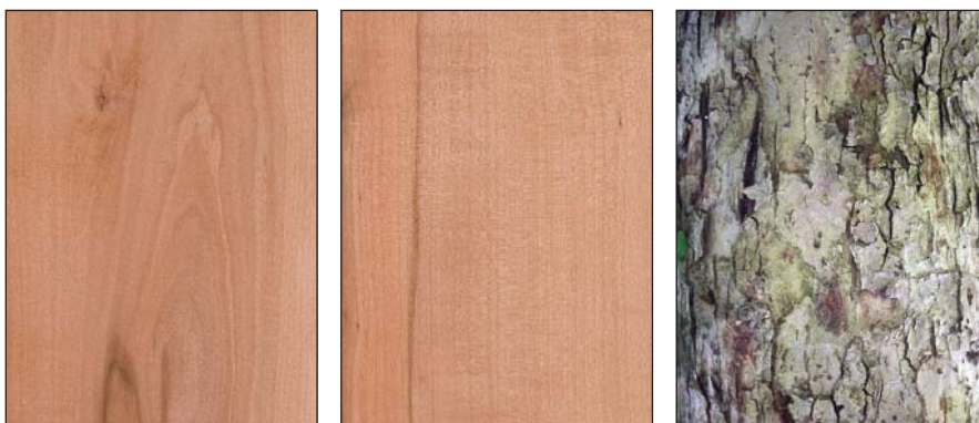
2. ábra A vadalma fájának húr- (bal) és sugármetszete (közép), valamint kérge (jobb)

Statikus hajlító rugalmassági modulus (MPa, u = 12%): 8200