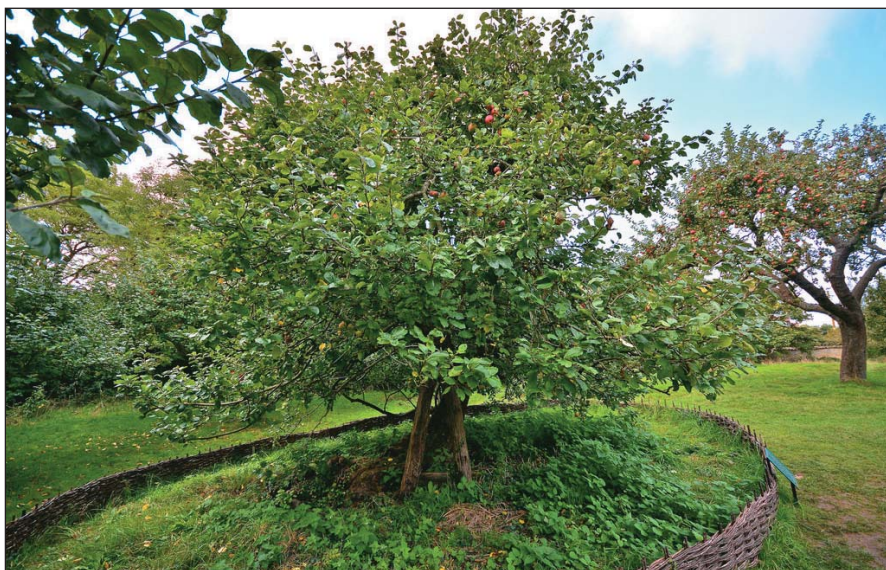
Newton almafája Woolsthorpe Manorban – York, Nagy-Britannia

Az alma gyógyhatását leíró történetek nem nélkülözik a mesés elemeket. A walesi legenda szerint a tündérannyától származó „myddfai fizikusok” gyógy-