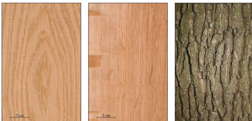
2. ábra A kocsányos tölgy fájának bőr- (bal) és sugármetszete (közép), valamint kérge (jobb)

hatású, sajátos szépségű rajzolatot, megjelenést adnak a tölgyfának.